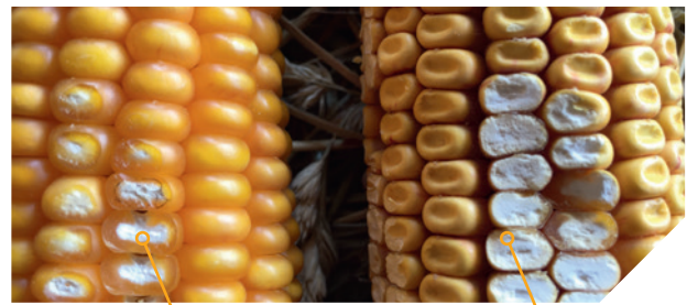
Grain corné denté* vitreux